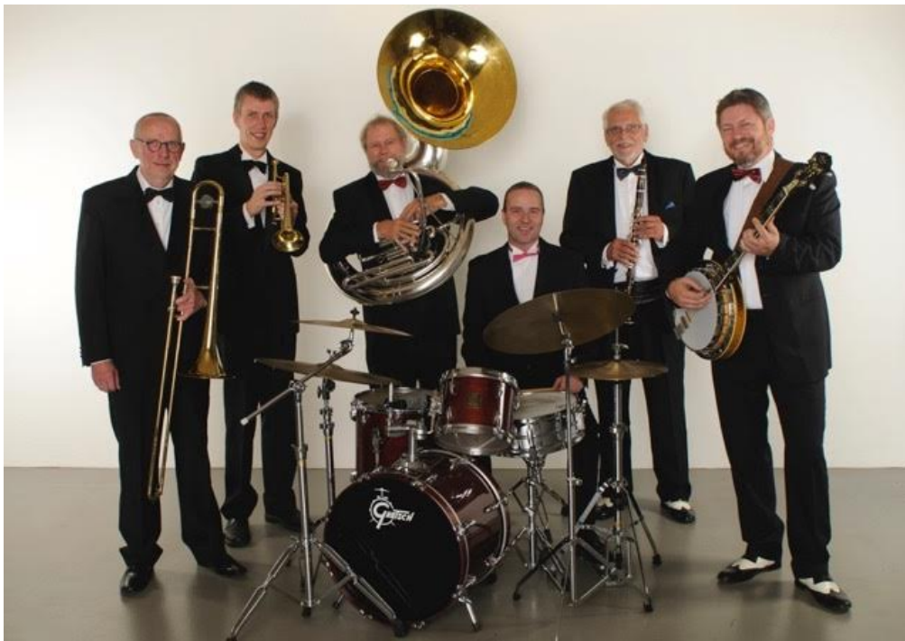
TUXEDO NEW ORLEANS JAZZBAND

Resten af programmet for sommer-jazzfestivalen har du her: